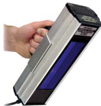
紫外灯连 CH-180 手柄