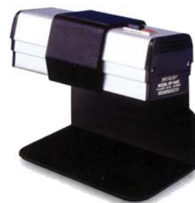
紫外灯连 SE-140 支架 (SE-140 支架另购)