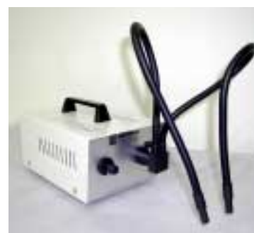
EK-1 型冷光源灯箱 配 MIC0214 型双鹅颈导光照明灯