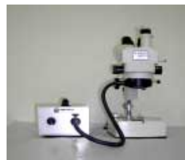
EK-1 型冷光源灯箱 配