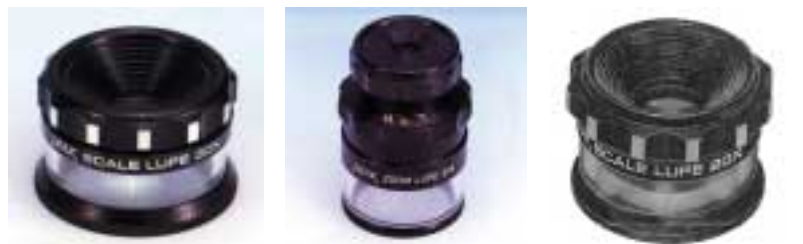
2037 scale lupe 附专用刻度片