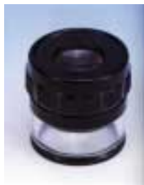
1983 scale lupe 有刻度放大镜 可配多种刻度片