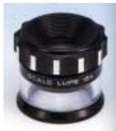
2016 scale lupe 有刻度放大镜 配标准型刻度片