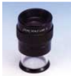
1975 scale lupe 有刻度放大镜 可配多种刻度片