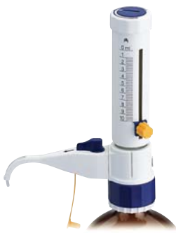
Dispet EX (试剂瓶另购)