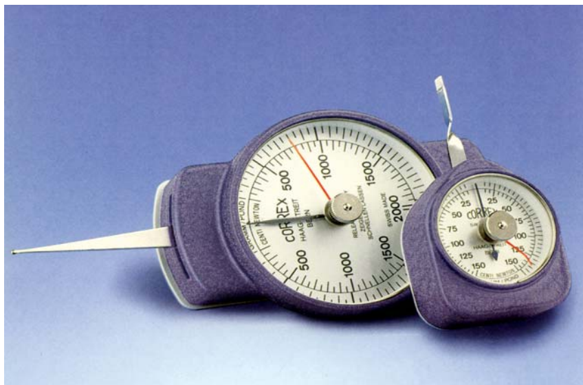
图示： 大型圆头触针(KM) 小型平头触针(FM)

瑞士 CORREX 张力计适合于精确测量继电器接点压力, 微型开关、阀门、精密弹簧压力, 刻度盘测量仪器主轴压力, 自动电话设备接点和衔铁压力等机械压力, 以及测量和检验打字机, 电传打字机, 电唱机唱头重量, 磁带录音机缓冲装置压力等。